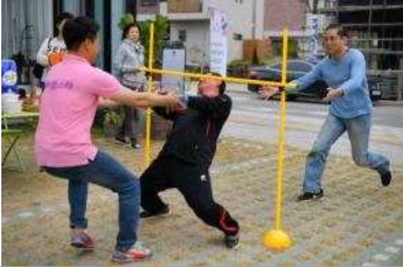
(경기 이천) 청년농부 토크콘서트, 케이팍스타 / 초록놀이터

이천 귀촌 청년 농부들이 모임을 만들어, 개인의 일상과 주민들의 일상을 기반으로 주민 참여 청년농부 토크콘서트 콘텐츠 개발