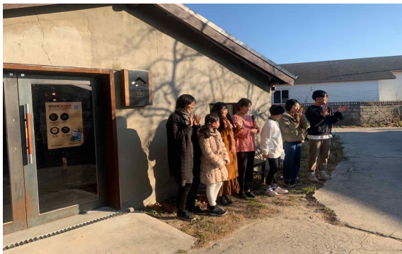
(강원 강릉) 지누아리를 찾아서 / 무엇이든

동두천의 지역 특성을 반영한 매거진 제작 및 생활창작변방학당 모임으로 지역주민들과의 공동 창작문화콘텐츠 개발 과정 지원