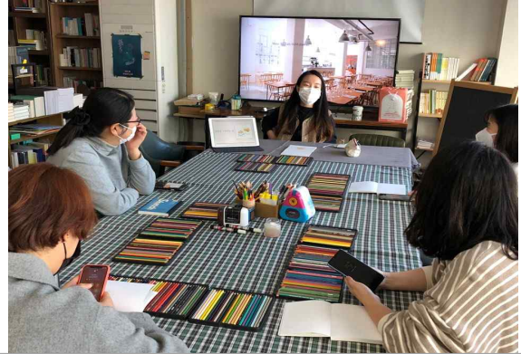
(경기 동두천) 생활창작변방학당 / 변방의 북소리

이천 귀촌 청년 농부들이 모임을 만들어, 개인의 일상과 주민들의 일상을 기반으로 주민 참여 청년농부 토크콘서트 콘텐츠 개발