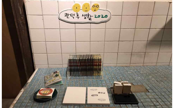
(제주 제주) 예술과 함께하는 원도심탐방 프로그램 만들기 / 아트세크

강릉 '지누아리'를 상징으로 청년들의 '지누아리'를 찾는 과정에서의 영감을 노래, 그림, 글 공유회로 기록하여 공유회 추진